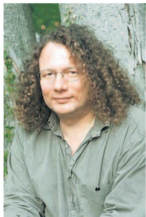
Ingo Schulze, 1962 in Dresden geboren, lebt in Berlin

wiedervereinigten Deutschland holt sie unerbitlich ein. Selbst mit dem übelsten Skandal, den sie aufdecken, erreichen sie nur noch ein Bruchteil jener Resonanz, die in alten DDR-Zeiten schon ein kleines ungenutztes Flugblatt erzielte. Und um die Zeitung am Leben und den Mitarbeitern die Arbeitsplätze zu erhalten, müssen sie sich weit mehr Gedanken über Betriebswirtschaft machen als über Politik. Schon nach ein paar Wochen sind die früheren Freunde tief zerstritten, und Türmer startet ein kostenloses Anzeigenblatt, das zwar Geld bringt, dafür aber auf jeden journalistischen Anspruch verzichtet.